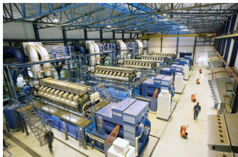
شکل ۱. کارگاه صنعتی